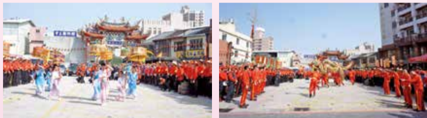
▲龍德宮四媽祖南巡遶境陣頭的精彩表演。

遶境前導車抵達廟埕，儘管廟方只燃放一串鞭炮，及刻意減低鑼鼓聲，卻沒有影響廟內及廣場人山人海信眾的熱情；各陣頭的精彩表演，信眾不時爆以熱烈掌聲。