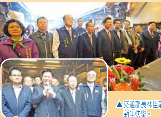
▲交通部長林佳龍大年初一到萬和宮參香，祝賀鄉親新年快樂。

另外，8點多，交通部長林佳龍趕個大早，偕同民進黨籍市議員張耀中及部分里長到萬和宮，由蕭董事長等陪同參香祈福，還與信眾親切打招呼，祝賀大家新春恭喜，新的一年平安發大財。