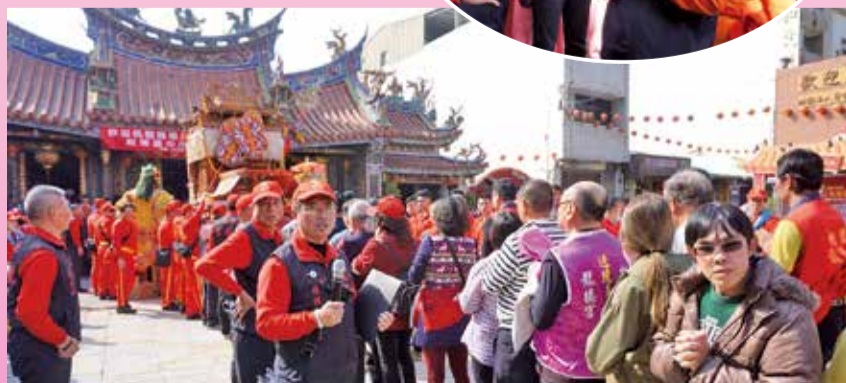
▲龍信眾等候後轎腳的熱鬧場面。

建築物古色古香；萬和宮特別重視文化、教育藝術推動，也有列為台中市無形文化資產的字姓戲等。他說，將來兩宮可以結為姊妹宮，一同推展發揚媽祖文化。