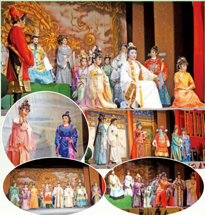
▲「財神報喜」劇情集錦。

透過演員們談諧、幽默風趣的對話，加上略帶誇張的動作，以及變化多端的布幕及音效，創造出極大笑果，滿場觀眾時而捧腹大笑，或拍手叫絕，歡笑、輕鬆、喜感籠罩全場。有些觀眾說：「很好看！真過癮！」