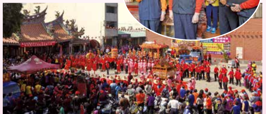
▲桃園龍德宮四媽祖南巡遶境駐駕，萬和宮廟埕盛況。

隨即在鐘鼓齊鳴聲中，進行莊嚴隆重的團拜儀式，兩宮董監事、管理委員會委員及信眾，虔誠的心情寫在臉上，祈求兩宮媽祖庇佑信眾平安，國泰民安、風調雨順。