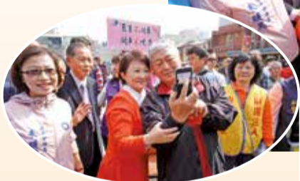
▲<<> 台中市長盧秀燕在萬和宮發紅包，與市民們親切互動。

盧秀燕祝賀爆滿的鄉親新年快樂。她說，有拜有庇庇，每年都會到香火鼎盛的萬和宮參香祈福，這次特別來感謝、還願、謝恩，謝謝媽祖庇佑她當選；同時贈送發財金小豬紅包，祝福市民們身體健康、閤家平安、豬年大發、大家賺大錢。市長也提醒大家，春節期間注意安全，酒後不開車，開車不喝酒。