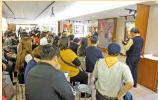
▲萬和美展頒獎典禮座無虛席。

46件獲得入選以上作品至5月26日在萬和文化大樓五樓麻茅文化館展覽。麻茅文化館開放參觀時間為每星期六、日及農曆初一及十五日。