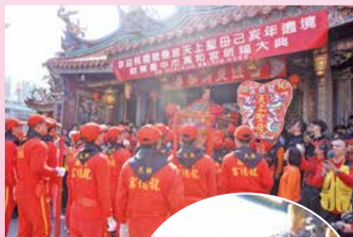
▲萬和宮熱烈歡迎龍德宮四媽祖駐駕的場景。

隨即在鐘鼓齊鳴聲中，進行莊嚴隆重的團拜儀式，兩宮董監事、管理委員會委員及信眾，虔誠的心情寫在臉上，祈求兩宮媽祖庇佑信眾平安，國泰民安、風調雨順。