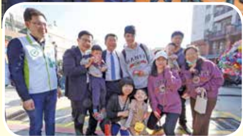
▲立法院副院長蔡其昌，大年初二度到萬和宮拜年、發紅包。