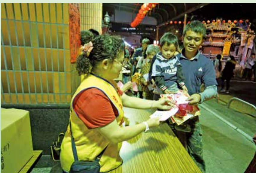
▲萬和宮元宵小提燈頗受鄉親喜愛。

萬和宮製作的賀歲小提燈，傍晚6點半開始發放，鄉親大長龍，揭開元宵晚會的序幕。今年己亥豬年的賀歲小提燈有「平安」與「如意」兩種款式，象徵吉祥、平安、如意，造型可愛，且洋溢年味，元宵過節應景，或居家擺飾都很討喜。