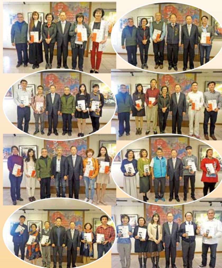
▲萬和美展得獎人與頒獎貴賓合影。