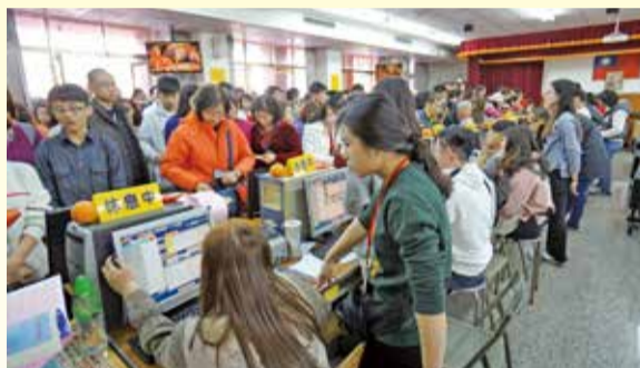
▲己亥豬年春節期間，萬和宮受理敬點光明燈盛況。