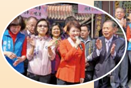
▲台中市長盧秀燕在萬和宮恭喜大家新年快樂！