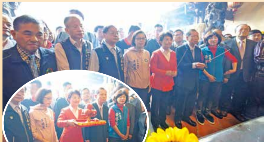
▲台中市新科市長盧秀燕蒞萬和宮參香、還願。

爆滿的善男信女，得知去年12月25日就職的新科市長盧秀燕，將蒞臨發紅包，立即沿著萬和路、媽祖巷至廟埕停車場排隊，綿延千公尺，好不壯觀。