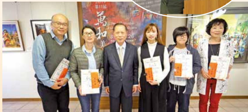
▲到場的萬和美展西畫類及攝影類前三名得主，接受蕭董事長道賀。

他和蕭董事長都鼓勵大家踴躍參加競賽，還特別指點獲獎訣竅：「以後各位要參加比賽，拿出最好、最大及最滿意的作品，得獎機會大！」下一屆萬和美展的競賽項目之一是書法，可以嘗試融合草書及楷書等呈現。簡大師期勉有意參賽的，及早準備。台下報以熱烈掌聲，謝謝大師指導。