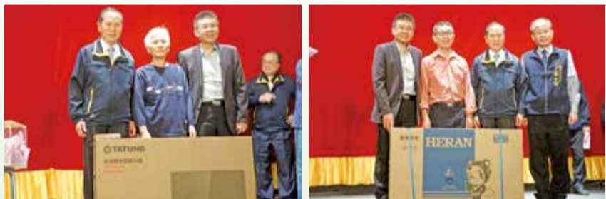
▲蕭董事長恭喜鄉親抽中大獎。

當天，分別於開演前及謝幕後，舉辦摸彩活動，萬和宮提供43吋液晶電視、多功能電鍋及商品禮券等獎品。