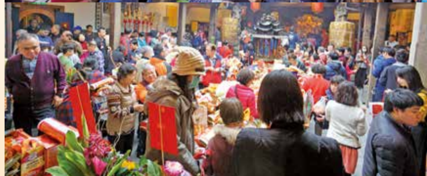
▲己亥豬年春節期間，萬和宮萬頭攢動強強滾。