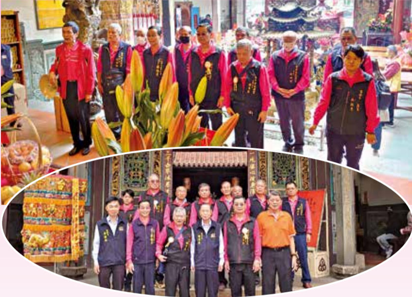
▲台中市成興宮320餘執事人員、隨香信眾遶境隊伍，參訪萬和宮。

4月8日上午8點半至9點15分，奉祀三府王爺的台中市成興宮，320餘執事人員、隨香信眾與陣頭組成的遶境隊伍，參訪萬和宮。