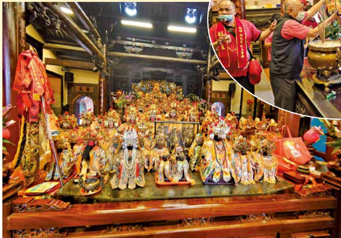
▲琉球朝天宮媽祖指定造訪萬和宮，前兩排為同行的16神尊。