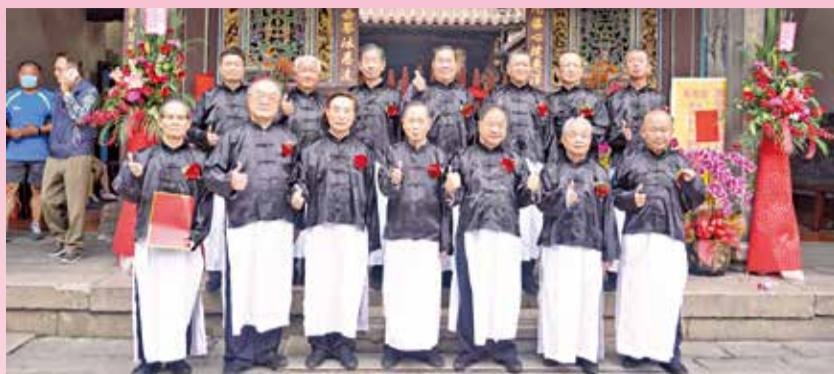
▲參加萬和宮三獻禮的執事人員與來賓合影留念。