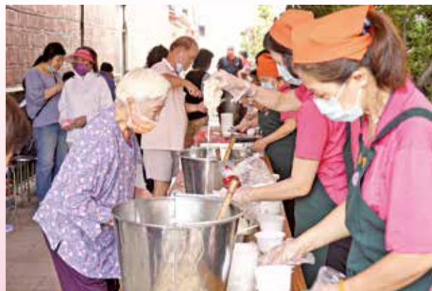
▲恭祝媽祖誕辰，萬和宮煮的壽麵很受歡迎。

工作重點說，感恩媽祖靈驗與庇佑，三年多以來儘管疫情肆虐，萬和宮安太歲及點光明燈等，依舊每年穩定成長，安燈的電系統也因需求更新。他也提到，明年欣逢媽祖鎮殿340週年及老二媽西屯省親遶境，均著手策劃活動。團隊優異的績效，獲得與會信徒代表肯定。