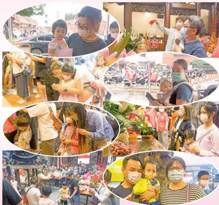
▲萬和宮媽祖契子女回宮祝壽集錦。