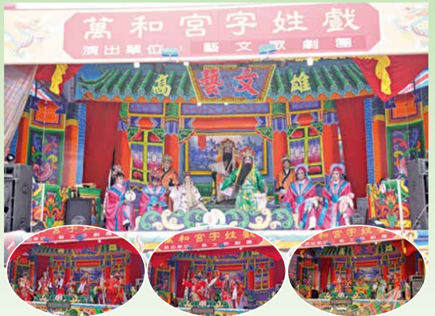
▲萬和宮字姓戲，今年由藝文歌劇團擔綱，耳目一新。