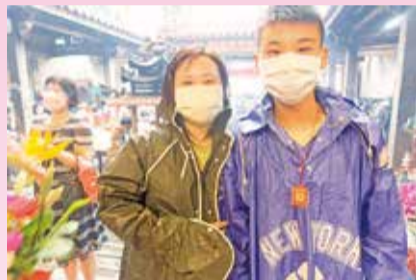
▲15歲顧宸睿也趕在16歲之前回宮，感謝媽祖娘娘的護佑。