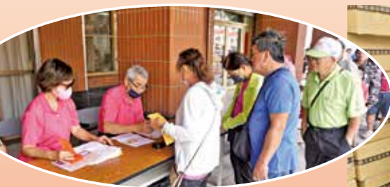
▲萬和宮發放低收入戶普度供品和一千元現金的場景。