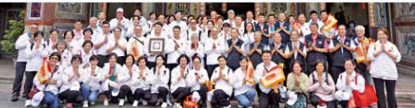
▲昆山媽遊台灣在萬和宮大合照。

2010年，昆山媽自鹿港天后宮分靈入火安座，是大陸華東地區規模最大的媽祖廟，曾於2014到2016年連續三年舉辦昆山媽回娘家活動，又於2022年舉辦「千里尋根」，護送媽祖回到故鄉福建莆田湄洲島。