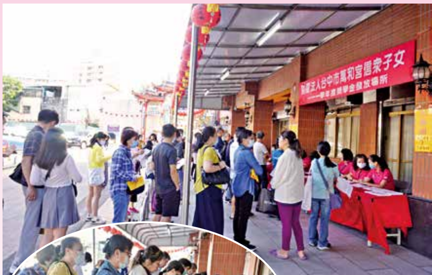
▲領取萬和宮獎學金的同學或家長，絡繹不絕。

大學部份，分別就讀北基宜、桃竹苗、中彰投、雲嘉南、高屏、花東地區及金門大學、澎湖科大離島等所。其中逢甲大學54人，台灣大學52人，中國醫藥大學34人。