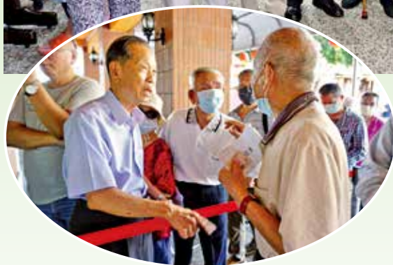
▲萬和宮發放敬老禮金，蕭董事長與耆老合影。