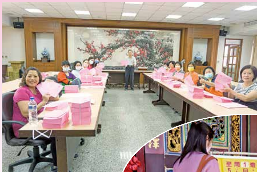
▲萬和宮在廟前張貼公告，提醒113年植斗安燈受理日期更改。

迎接新的一年，萬和宮也排定多項「辭舊歲，迎新春」活動，元月卅一日謝斗法會，二月四日送春聯，二月廿一日植斗法會。