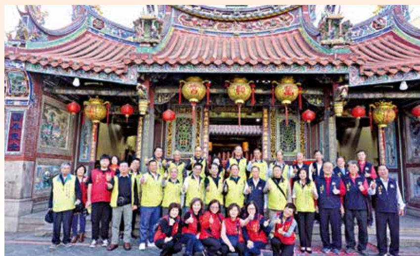
▲宜蘭縣二結王公廟董監事參訪萬和宮合影留念。

這項活動的精華是，信徒帶著神轎，依王公指示到村裡找尋乩童，並用一根細長的銅針貫穿乩童兩頰，代表依王公意旨行事，且要緘默，在過程中一句話都不能說，接著才回到廟埕過火，稱為稱「抓乩童」。過火後，信徒會拿衣服在火堆上揮舞，以消災祈福。