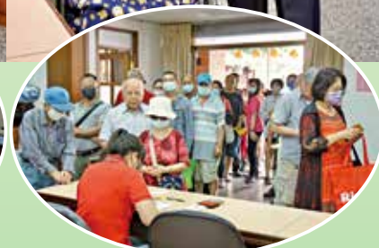
▲萬和宮發放敬老禮金場景。