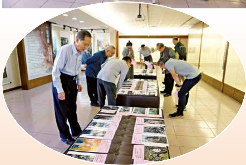
▲評審委員們聚精會神審查作品。

初審結果，國畫類受理73件，通過31件；書法類受理31件，通過16件，合計47件獲得初審通過。美展籌備會隨即寄發初審結果，通知入選者在期限內，繳交參賽原作，擇期複審。評審委員們讚許說，從參賽作品普遍夠水準。